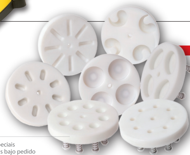
Discos especiais disponíveis bajo pedido